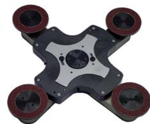
SHS 600 Planetenscheibe