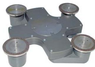
SHS 600 Planetenscheibe