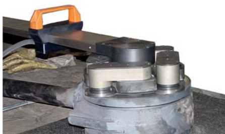
SHS 600 Schleifen eines Schieberkeils