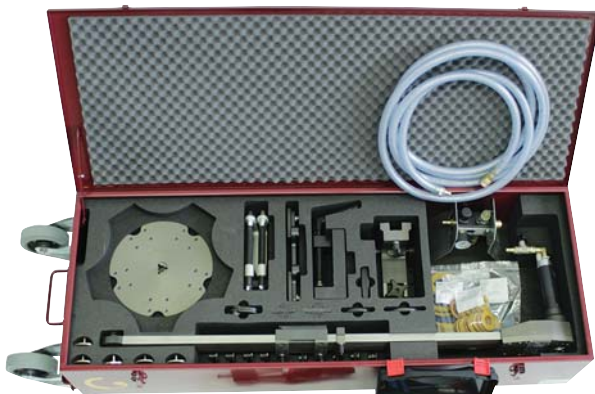
SLIM 300 Transportkoffer mit Zubehör

CBN-Hochleistungsschleifplaneten (CBN = kubisches Bornitrid).