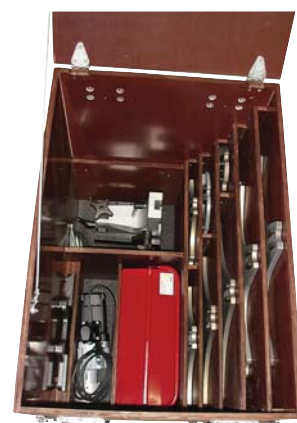
SLIM 1000 Transportkoffer mit Zubehör