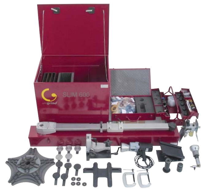
SLIM 600 Lieferumfang